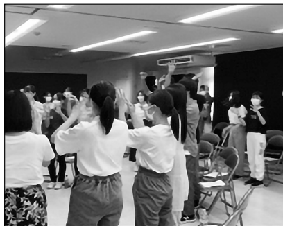
瀬戸内町の町役場の職員の方々との対話の様子

夕方は、奄美市内の商店街で自由散策を実施した。グリーンストアという現地のスーパーマーケットをまわり、現地の特産品を見たり、商店街の振興のために働く人たちの話を聞いたりして時間を過ごした。現地のお店には東京では販売されていない商品が多数あり、生徒たちはみんな商品を興味深く眺めていた。