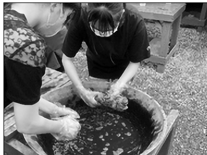
Tシャツ泥染め体験の様子