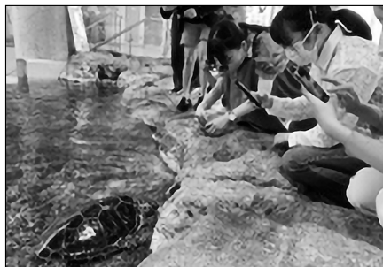
ウミガメのエサやり体験の様子