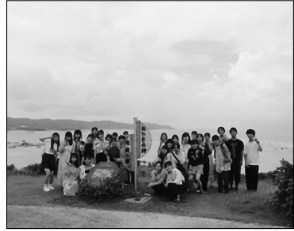
あやまる岬にて記念撮影

羽田から約2時間のフライトで奄美空港に到着し、空港からバスであやまる岬に移動した。あやまる岬を自由に散策した後、奄美市笠利町にあるホテル「コーラルパームス」に到着した。