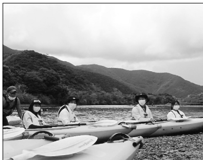
マングローブパークでのカヌー体験の様子

この日は夕方までホテルには帰らない行程だったが、多くの生徒が着替えを持ってきていなかった。奄美大島の天候の変わりやすさを考えると、着替えを持っていくように指導すべきだったという反省が残った。