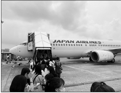
羽田空港から航空機に乗り込む