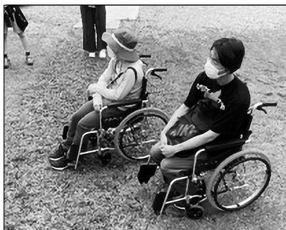
ゼログラビティ 清水ヴィラでの見学の様子