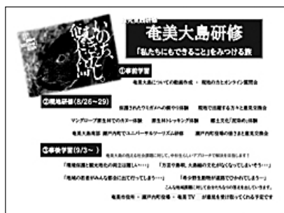
本校の文化祭「緑苑祭」で掲示したポスター