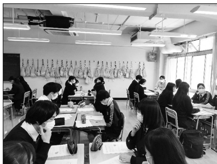
第1回事前研修（2022年4月30日）の様子